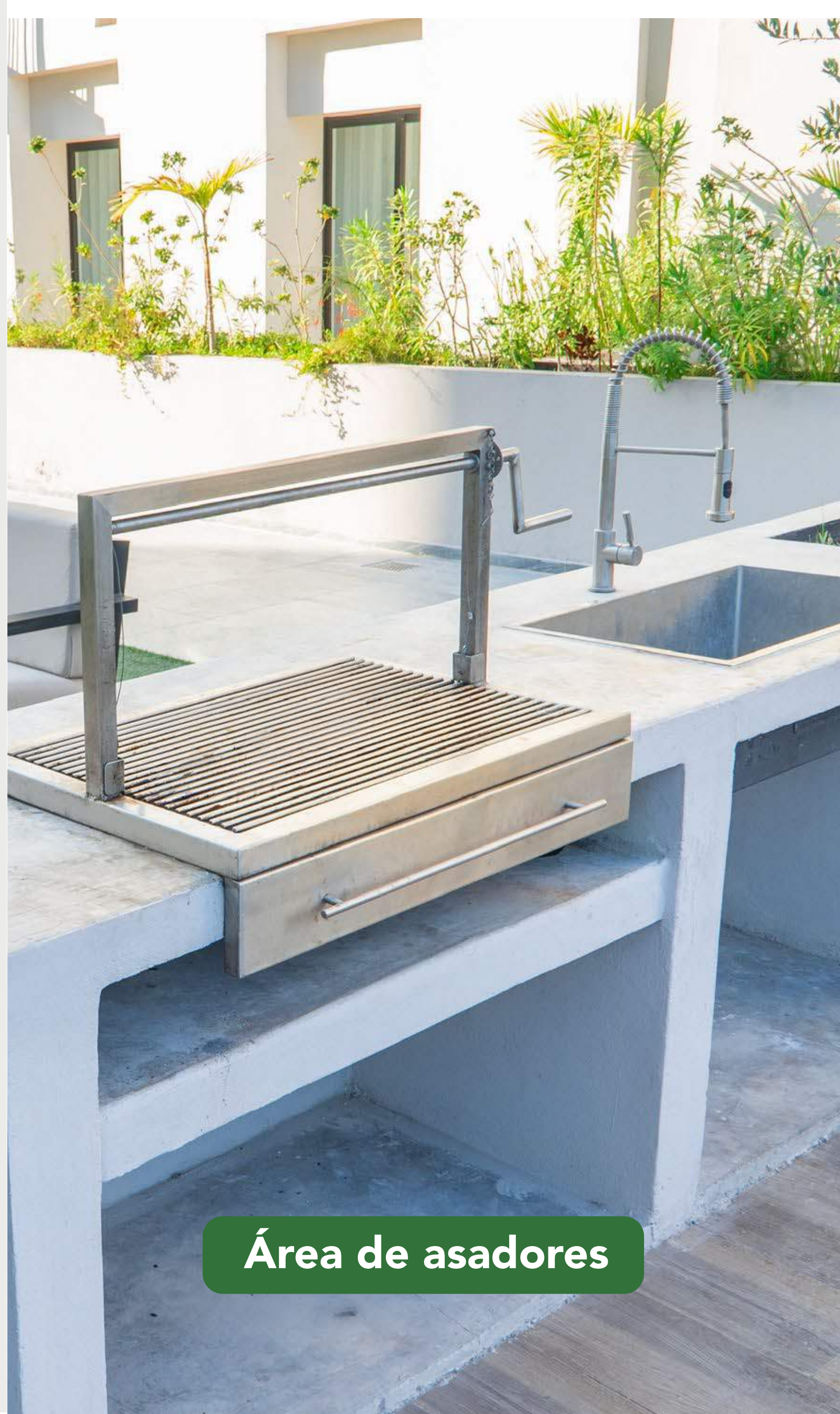
Área de asadores