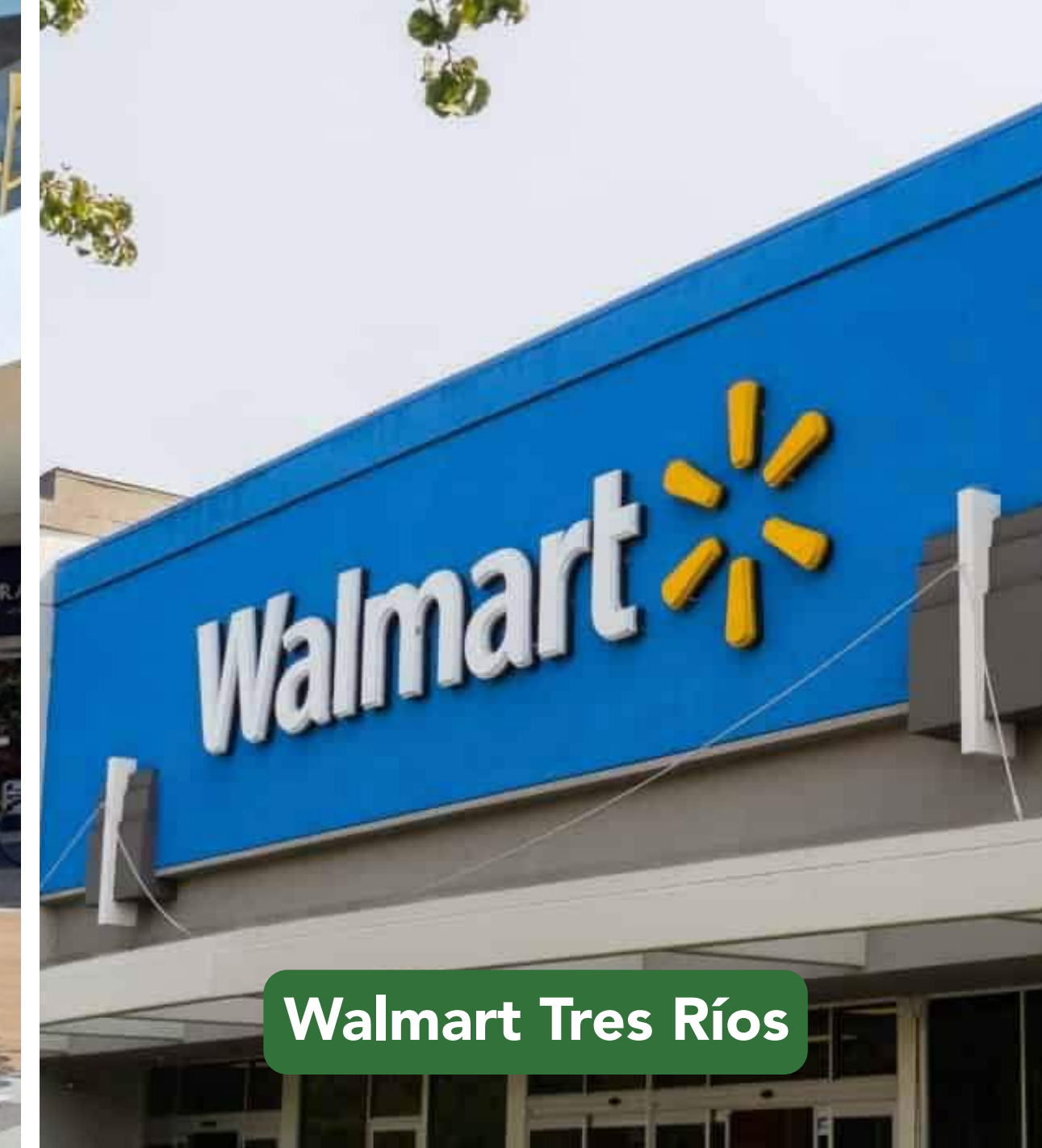
Walmart Tres Ríos