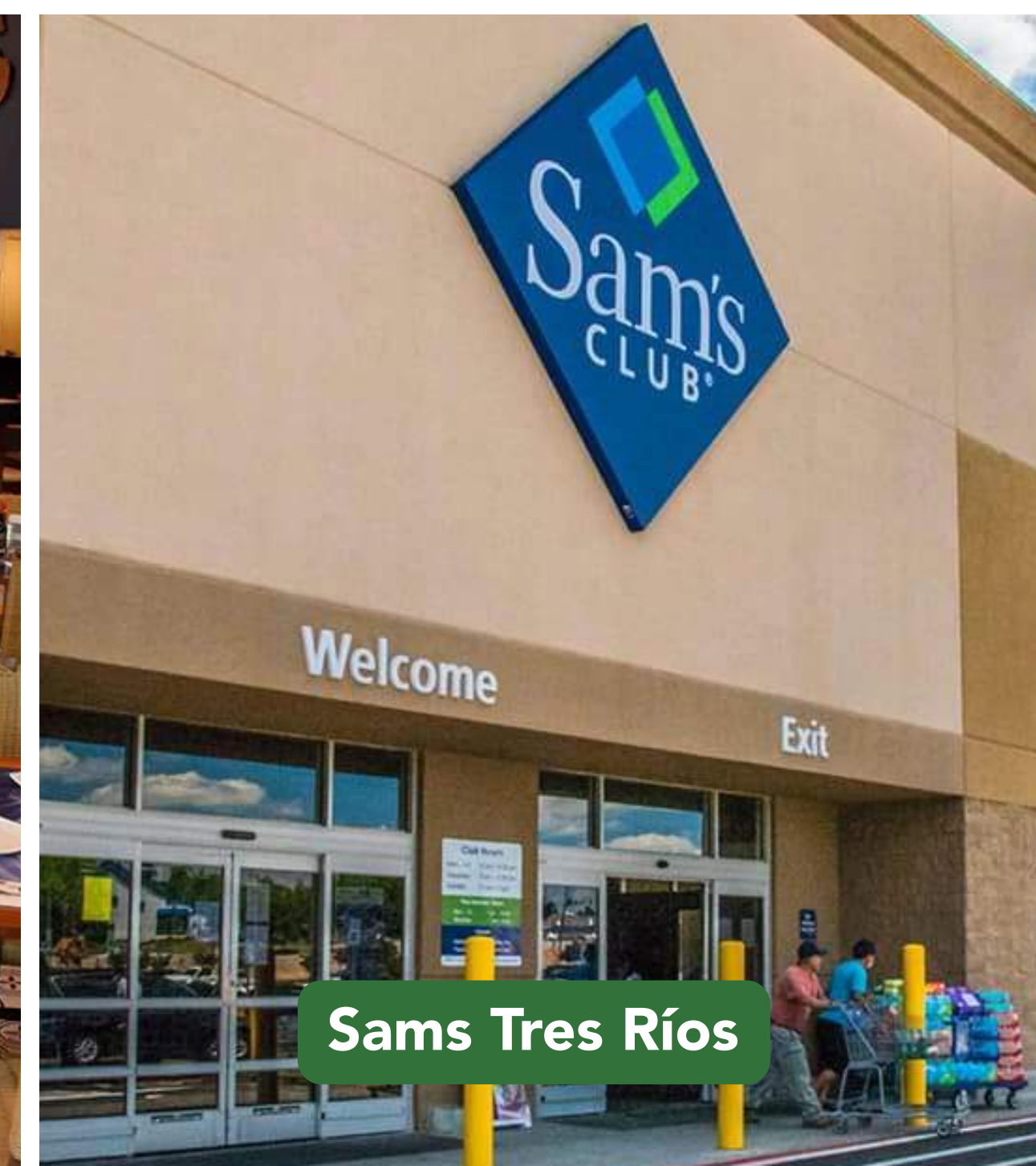
Sams Tres Ríos